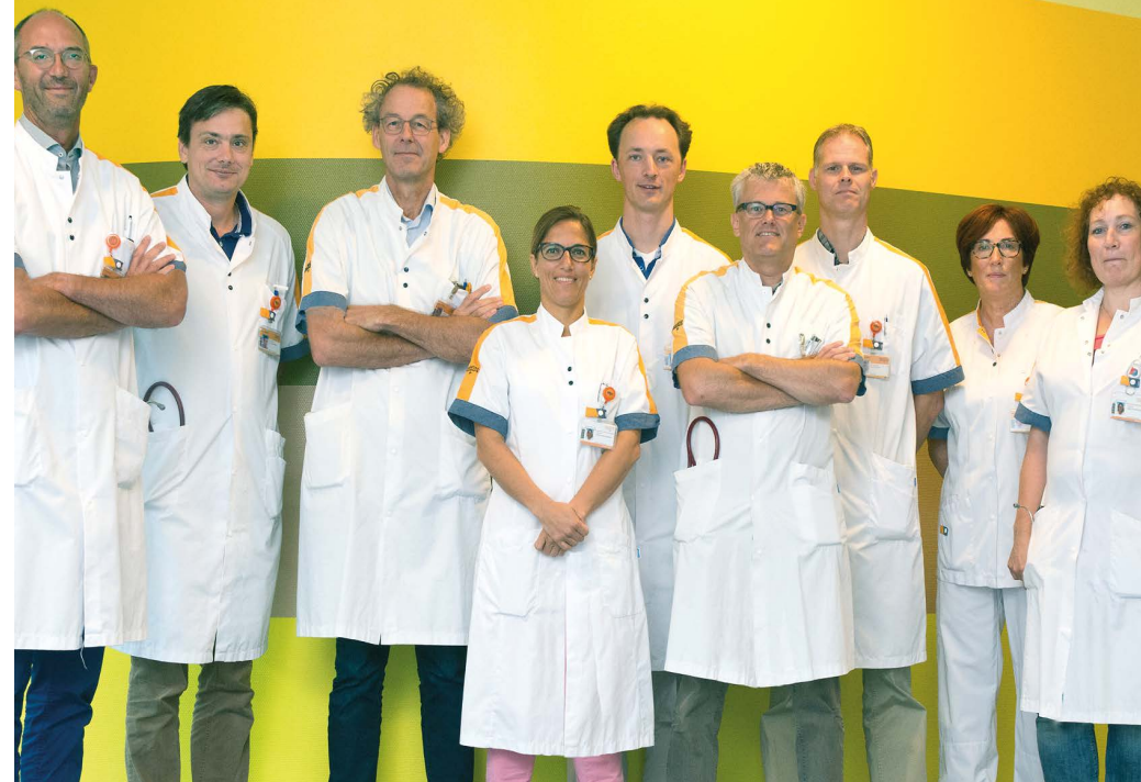
Nefrologen en verpleegkundig specialisten Maasstad Ziekenhuis.

Op het gebied van transplantatie werken we nauw samen met het Erasmus MC. De voorbereidende onderzoeken vinden plaats in ons ziekenhuis. Zowel de ontvanger als eventuele donoren worden in een traject met een korte doorlooptijd (gemiddeld 3 maanden) voorbereid in ons ziekenhuis, waarbij een transplantatieverpleegkundige dit proces coördineert. De transplantatie zelf en de eerste kritische periode nadien vinden plaats in het Erasmus MC en de langetermijn follow up na transplantatie in het Maasstad Ziekenhuis. Het percentage transplantaties ligt hoog in het Maasstad Ziekenhuis, waarbij we sterk inzetten op zogenaamde pre-emptieve transplantatie: transplantatie voordat de patiënt dialyseert met een nier van een levende donor.